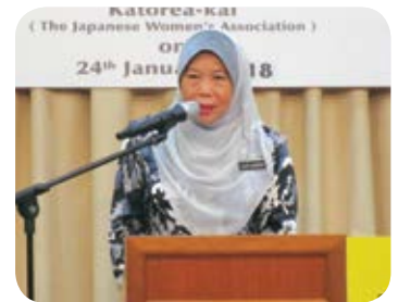
アジザ女性・家族・社会開発副大臣よりメッセージ

KL日本人会のチャリティバザーは、多くのマレーシアの方達が楽しみにしている、心のこもった素晴らしいバザーです。これから皆様のご協力と善意が日本とマレーシア両国の架け橋となり、日の当たりにくい社会福祉施設の人々の笑顔につながることを願っております。