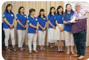
かとれあ会役員全員から寄付金の贈呈