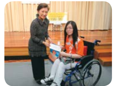
宮川大使夫人から寄付金の贈呈