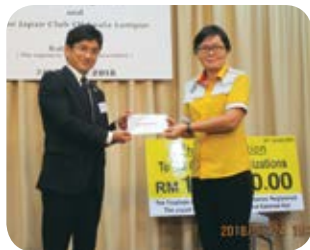
岡部バザー実行委員長から寄付金の贈呈