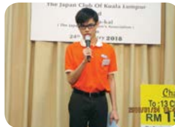
ディスプリングクランの青年によるスピーチ