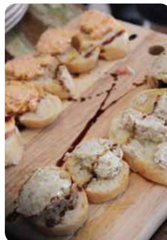
マスカルポーネチーズとサラミ、ペペローニペースト、バルサミソースでこんなに素敵な前菜がババっとできます!