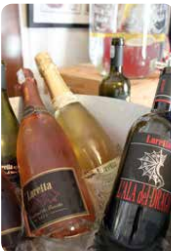
ルレッタ オーガニックワイン