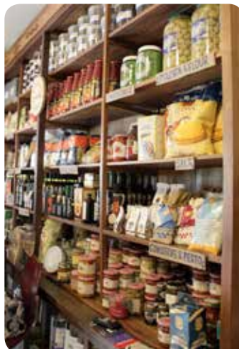
パスタやオリーブオイルも豊富