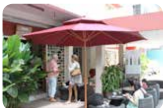
週末の店頭ワイン会