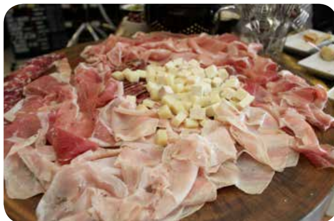
生ハムやチーズが食べ放題@店頭ワイン会