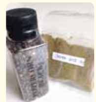
左：黒胡椒(粒) RM14(50g) 右：Za'atar RM2.3/25g