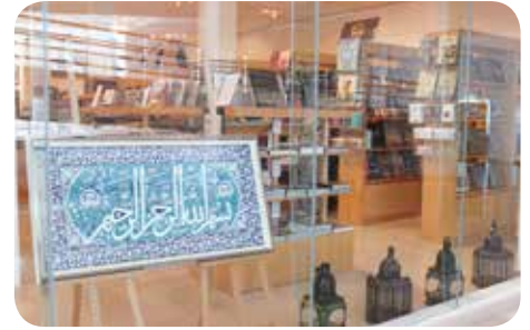
イスラム美術館 (ショップとレストランのみの利用は入館料無料。月曜休館)