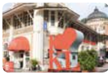
ARCH @KL City Gallery (ムルデカ広場横、9am 開店)

ちょっと洗練された、素敵なお土産がそろっています。観光も兼ねて、足を運んでみてください。きっと新しい発見がありますよ♪